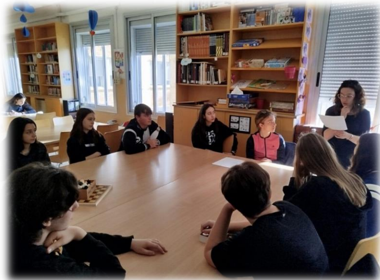
Sesión del Club de lectura