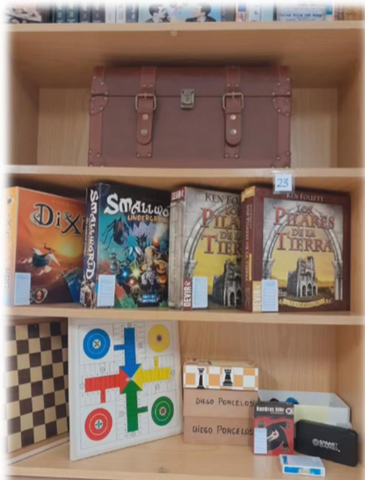
Juegos de mesa en la biblioteca