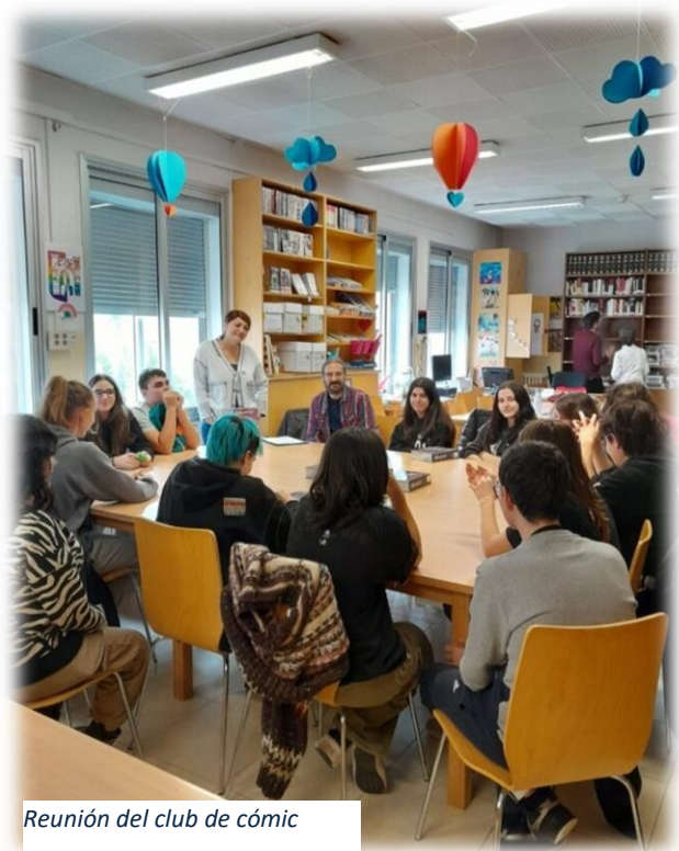
Reunión del club de cómic

Durante el tercer trimestre las sesiones se realizaron conjuntamente con los participantes en el club de lectura de cómic de segundo ciclo de la ESO y Bachillerato.