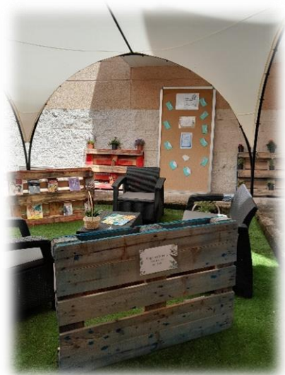
Adecuación del patio interior