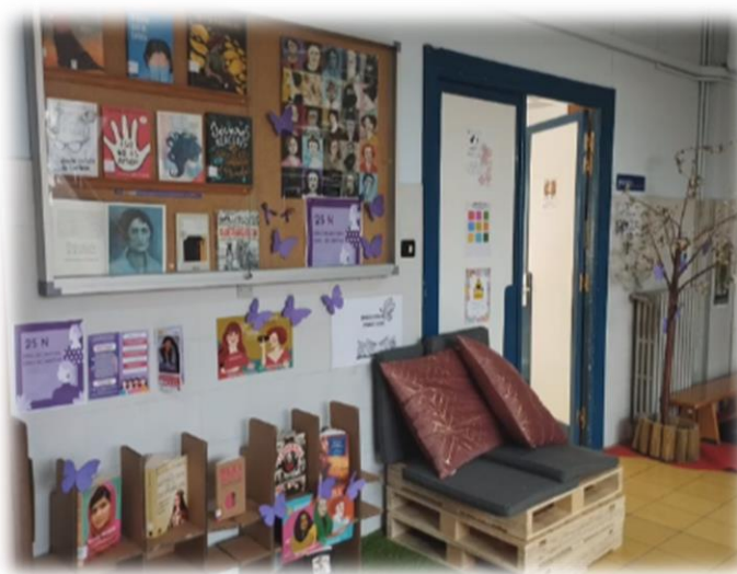
Vitrina del 25 de noviembre

En algunas ocasiones se exponen las novedades de la biblioteca, pero también se realizan