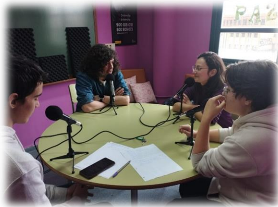
Grabación del episodio 3