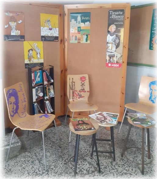
Conquista en la entrada del centro

Durante el desarrollo del proyecto a lo largo del curso escolar trabajamos en torno a las siguientes líneas de actuación: