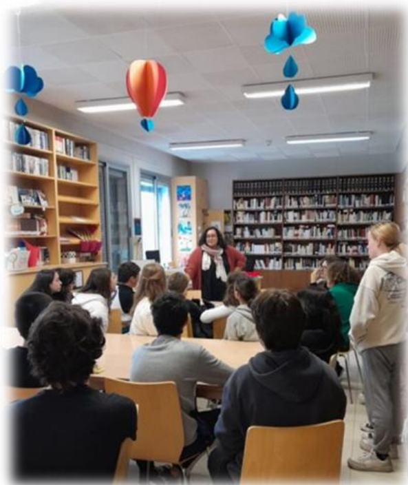
Reunión de Vive, sueña, lee

✓ Alumnado : es clave resaltar la participación del grupo de fomento Vive, sueña, lee , compuesto por 63 alumnos y alumnas de la ESO y Bachillerato.