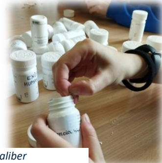
Vive, sueña, lee preparando Farmaliber