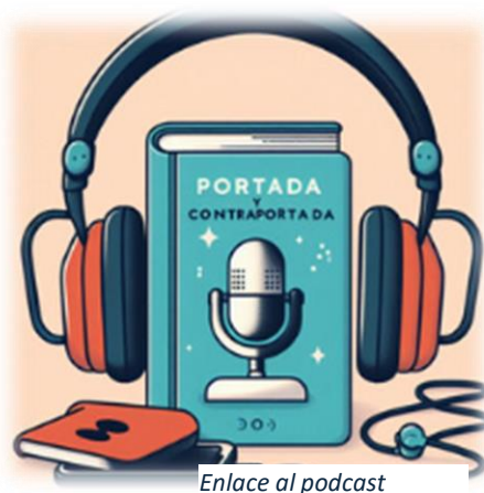
Enlace al podcast