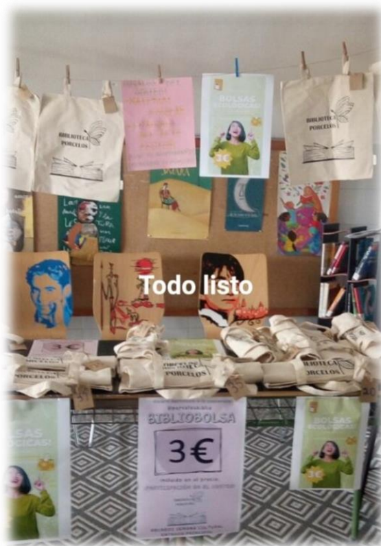
Promoción en redes del mercadillo

Durante el curso pasado y con la colaboración del Dpto. de Dibujo se organizó un concurso para la elección de un logo de la biblioteca. Una alumna que durante el curso pasado cursaba 3º de la ESO ganó este concurso. Su propuesta, además, recoge una de las pautas que les sugeríamos: queríamos que en nuestra imagen estuviera presente la mascota de la biblioteca, la librélula , criatura inventada y cedida por una de las integrantes del grupo Vive, sueña, lee . Este tipo de actividades nos ilusionan especialmente, ya que vemos cómo obtenemos resultados que aúnan distintas propuestas de los alumnos. También tenemos mucho interés en que ellos vean materializadas sus ideas y cómo estas se convierten en señas de identidad del