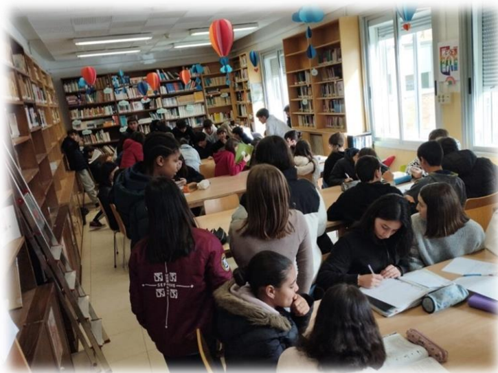
Recreos en la biblioteca

c) Facilitar al alumnado el aprendizaje de estrategias que permitan discriminar la información relevante e interpretar una variada tipología de textos, en diferentes soportes de lectura y escritura.