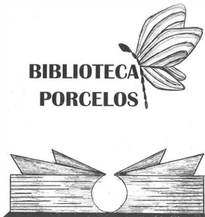
Logotipo de la Biblioteca

La filosofía de este proyecto partía de la consideración de que, así como en un bosque cada organismo crece único y diferente, pero todos necesarios e imprescindibles para el conjunto, una comunidad educativa ha de fomentar los potenciales individuales y vertebrarlos en torno a una identidad. Buscamos sentirnos en un lugar seguro, que fomente nuestro crecimiento haciendo que florezcan nuestras peculiaridades y que la creatividad dé sus frutos. Con nuestro proyecto hemos querido y queremos sembrar, regar, cuidar las semillas con respeto y verlas crecer felices y seguras empleando la mejor herramienta con la que podemos contar: la palabra, que representa creación, expresión, sentimiento, búsqueda, identidad, imaginación, emoción. La