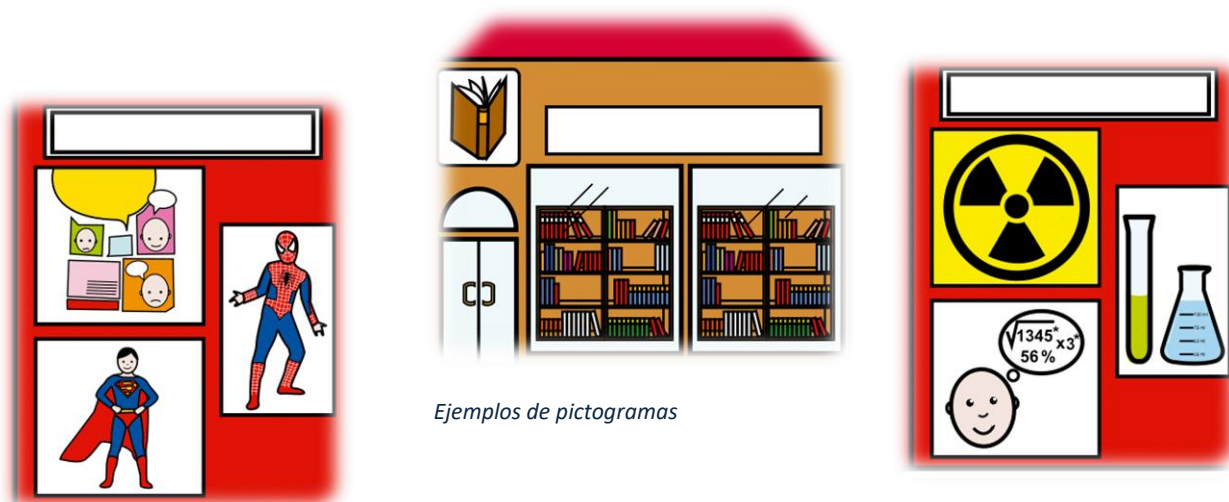
Ejemplos de pictogramas

7.4 Colocación de pictogramas y recursos para la comunicación aumentativa y alternativa: hemos continuado con esta iniciativa impulsada en cursos anteriores por el departamento de Orientación desde la materia de Psicología de 2º de Bachillerato. consistente en la colocación de pictogramas y recursos para la comunicación aumentativa y alternativa en lugares significativos del centro. El material ha sido proporcionado por la Asociación ARASAAC. En el presente curso, se ha finalizado la señalización de la distribución de fondos de la biblioteca. Estos sistemas pictográficos se aplican a personas que no están alfabetizadas a causa de la edad o la discapacidad. Tienen la ventaja de permitir desde un nivel de comunicación muy básico, que se adapta a personas con niveles cognitivos bajos o en etapas muy iniciales, hasta un nivel de comunicación muy rico y avanzado.